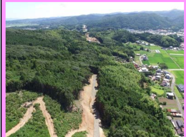
18. 長久地区改良第2工事 概要：道路改良 受注者：㈱フクダ