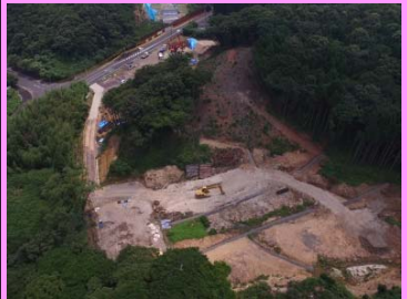
24. 鳥井地区改良第3工事 概要：道路改良 受注者：㈱フクダ