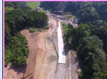
2. 鳥井地区改良第2工事 概要：道路改良 受注者：大福工業㈱