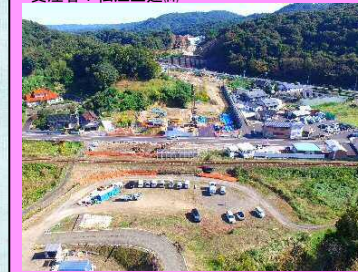
22. 久手高架橋下部工事