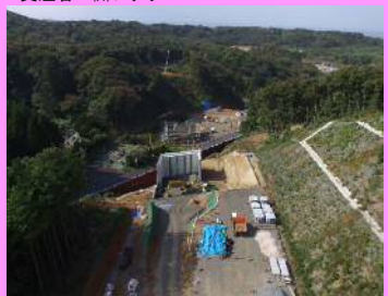
18. 長久地区改良第2工事