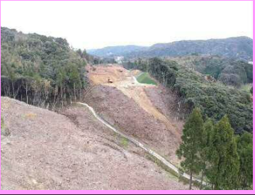
28. 鳥井地区改良第4工事 概要：道路改良 受注者：㈱中筋組