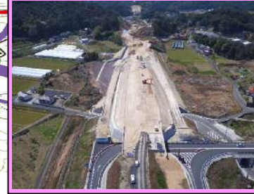
5. 久手地区改良第2工事 概要：道路改良 受注者：今岡工業㈱