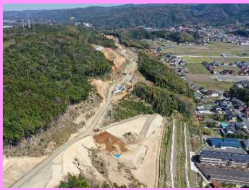
27. 長久地区改良第3工事 概要：道路改良 受注者：カナツ技建工業㈱