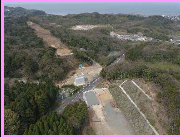
24. 鳥井地区改良第3工事 概要：道路改良 受注者：㈱フクダ 2年3月完成