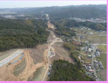
18. 長久地区改良第2工事 概要：道路改良 受注者：㈱フクダ