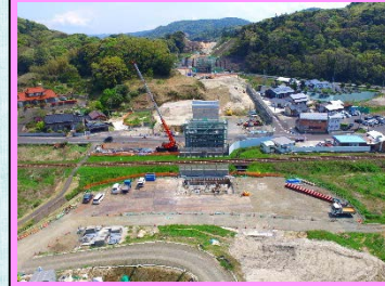
2. 久手地区改良第4工事