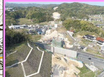
5. 久手地区改良第2工事