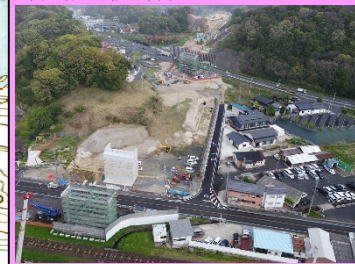
22. 久手高架橋下部工事