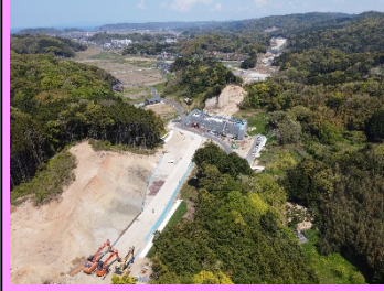
6. 久手地区改良第3工事