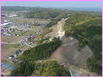
28. 鳥井地区改良第4工事