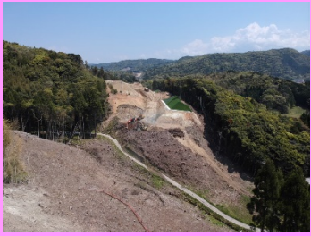
13. 鳥井地区改良第5工事