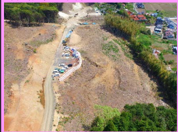
18. 長久地区改良第2工事