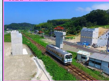
2. 久手地区改良第4工事