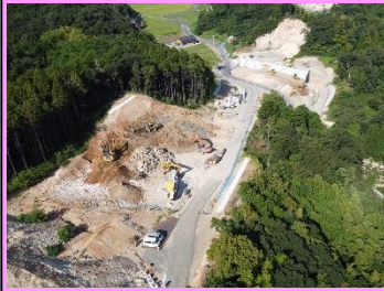
6. 久手地区改良第3工事