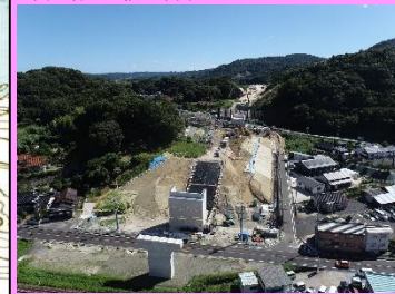
22. 久手高架橋下部工事