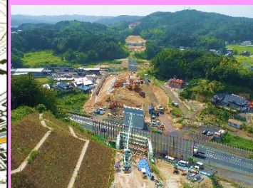
5. 久手地区改良第2工事