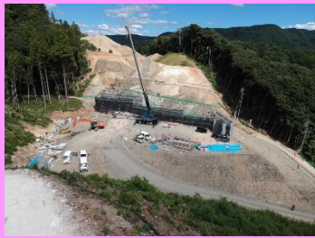
13. 鳥井地区改良第5工事