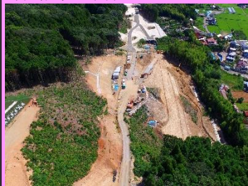
18. 長久地区改良第2工事