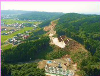
28. 鳥井地区改良第4工事