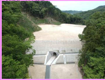
9. 五十猛トンネル工事