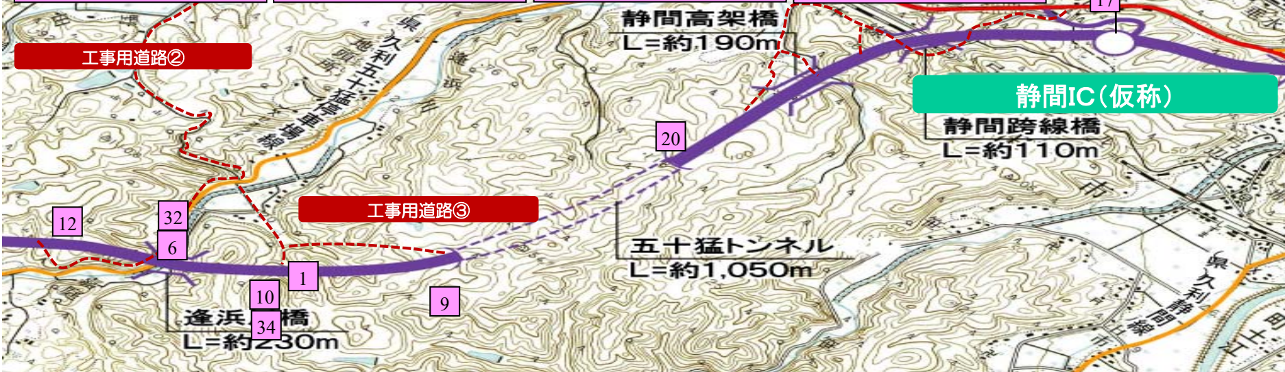
6. 逢浜川橋下部第2工事