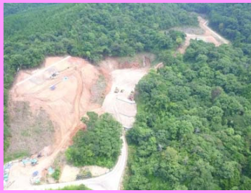
17. 静岡地区改良第8工事