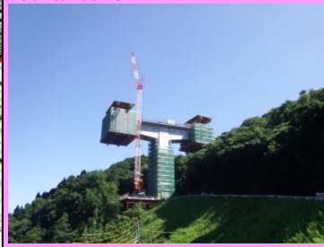
10. 五十猛地区東部改良第7工事