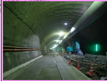
1. 五十猛地区東部改良第9工事