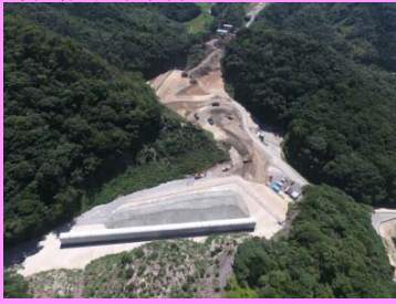
20. 静岡地区改良第5工事