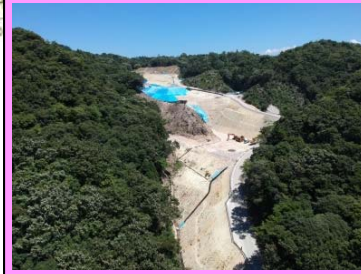
12. 五十猛地区西部改良第3工事