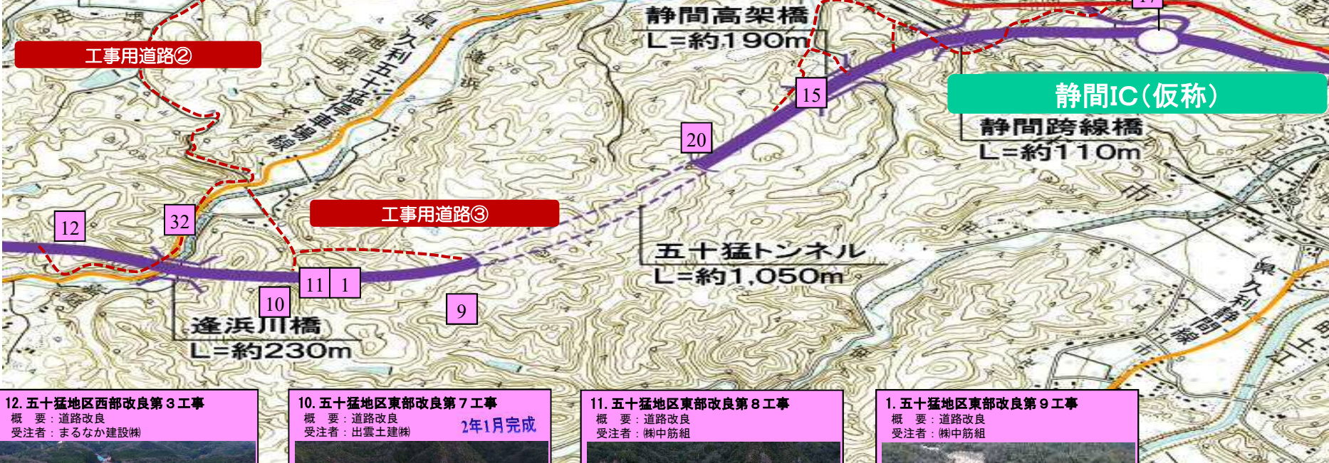
12. 五十猛地区西部改良第3工事