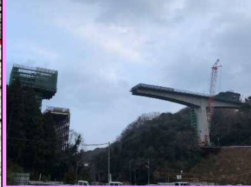
9. 五十猛トンネル工事