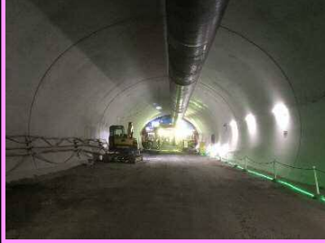
20. 静岡地区改良第5工事