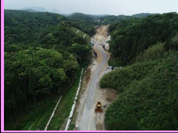
7. 五十猛地区西部改良第4工事