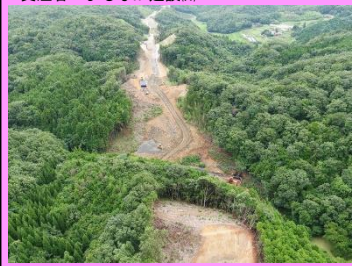
7. 五十猛地区西部改良第4工事