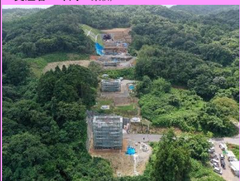
8. 静岡高架橋下部第1工事