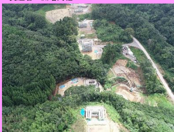
17. 静岡地区改良第8工事