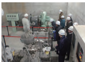
河川・ダム管理状況説明

過去の水害などの伝承や、防災に関わる活動、またダムなど河川にある施設での説明会などを実施します。