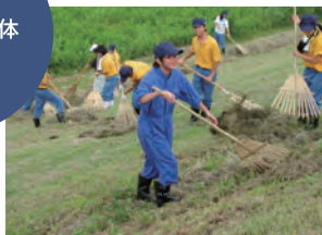
河川の除草・集草