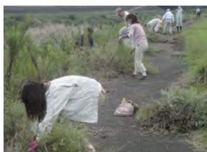
外来植物調査・駆除

水生生物の調査研究や、生態系を維持するために外来生物の駆除活動などを行い、河川の環境を維持します。