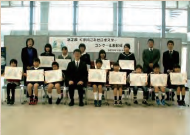
【熊本県】球磨川 次世代のためにがんばる会

河川協力団体は市民と河川管理者、双方の立場を理解し、活動しています。市民と河川管理者の間に立つことで、お互いの視点や想いを融合することが出来ます。その結果、河川の利活用や維持・管理につながります。