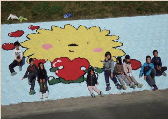
【徳島県】桑野川 横見町をきれいにする会

誰でも、いつでも気軽に近づく快適な河川空間は維持・管理が重要です。河川協力団体が実際の作業を行うにあたって、河川管理者と河川協力団体が協力して計画を作成するなど、両者が一体となって安心・安全な河川空間の維持・管理の質の向上につながっています。