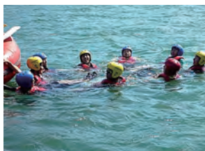
水辺の安全利用講習会

河川や河川空間を使って、観察会や、安全に河川を利用するための講習会などを実施します。