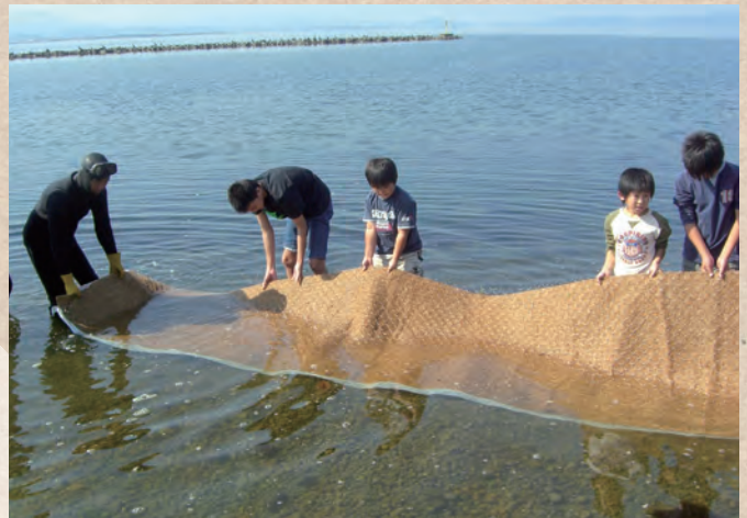
【鳥取県・島根県】中海 NPO法人 未来守りネットワーク

河川協力団体によるアマモ場再生への取り組み。作業に地域の子ども達も参加することで、自分達が住む地域への関心や、自然環境に対する意識の向上につながっている。