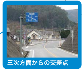
三次方面からの交差点