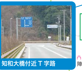
知和大橋付近T字路