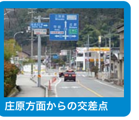
庄原方面からの交差点