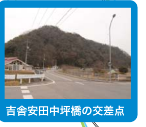
吉舎安田中坪橋の交差点