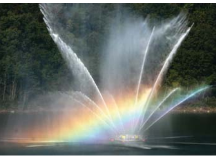
ハイツカ湖の噴水

■ル・サンク 添加物を使わない素朴な味わいが人気のパン屋です。国内産小麦を自家製天然酵母で発酵させ、石窯で焼き上げます。庄原市総領町五箇289 0824-88-7937