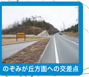
のぞみが丘方面への交差点