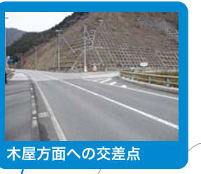
木屋方面への交差点

■ハイツカ湖畔の森 地元食材を多用したこだわり料理が楽しめるカフェレストランです。宿泊できるコテージや遊具、テニスコートや陶芸学習舎も併設。三次市三良坂町仁賀563 0824-44-3770