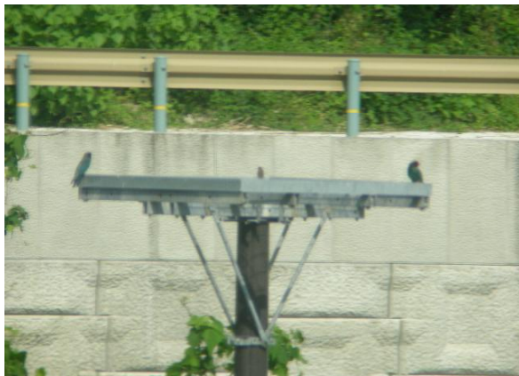
↑ ブッポウソウ(つがい)

今年設置した巣箱にブッポウソウが産卵しました。待つヒナのもとへ行ったり来たりするブッポウソウの姿を観察してもらいました。