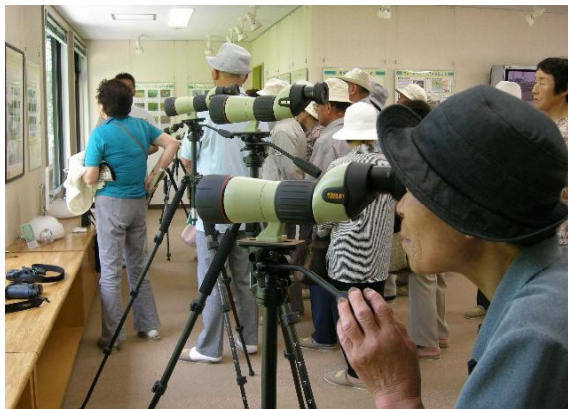
↑ ウェットランド見学