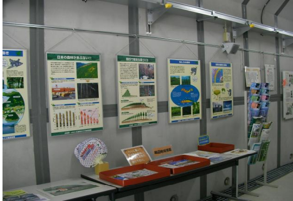
↑ 地域イベントのチラシなど

地域のイベントのチラシなども置いたところ、遠方からこられた方々に興味をもっていただきました。