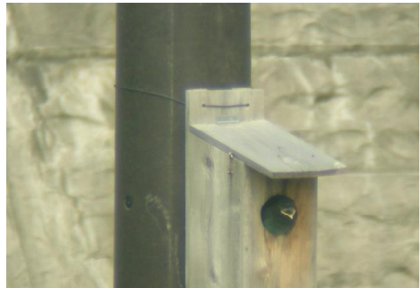
↑ ブッポウソウ(ひな)