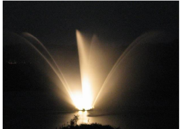
↑ 湖面に一本のろうそくが・・・