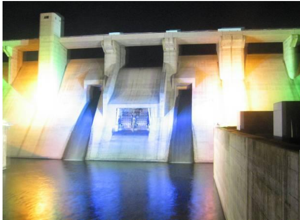
↑ 熱帯夜にカラフルに浮か上がる 灰塚ダム

カメラ撮影される方、家族、恋人?いろいろな方に普段とは違う風景を味わっていただきました。