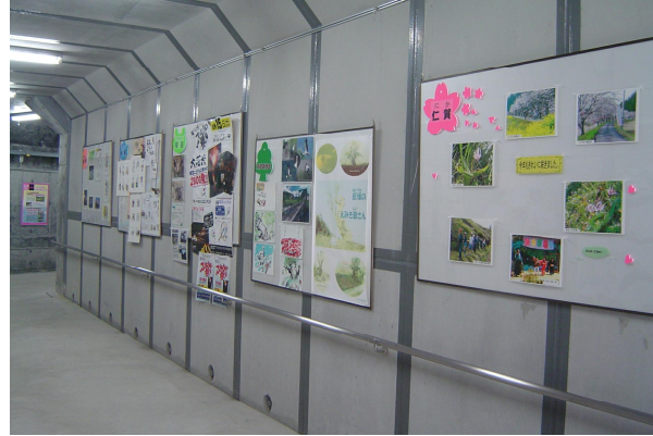
↑ 地域情報コーナー