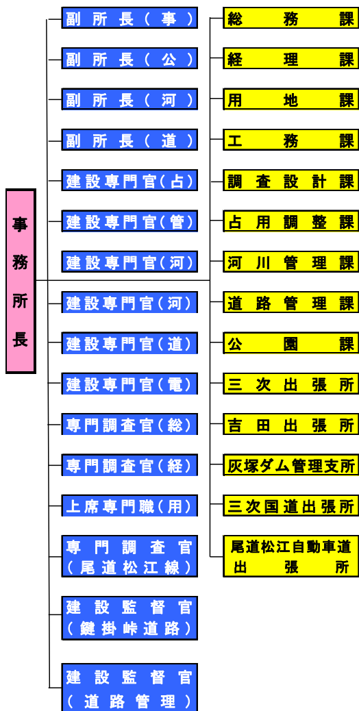
三次河川国道事務所組織図