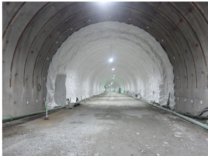
写真④ 令和7年度鍵掛峠道路トンネル覆工その他工事