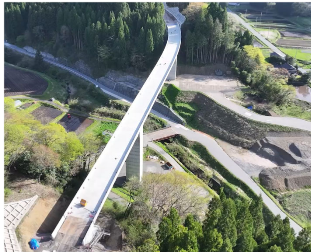
写真② 令和5年度鍵掛峠道路第5橋PC上部工事