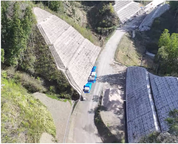
写真① 令和7年度鍵掛峠道路日南地区第2改良工事