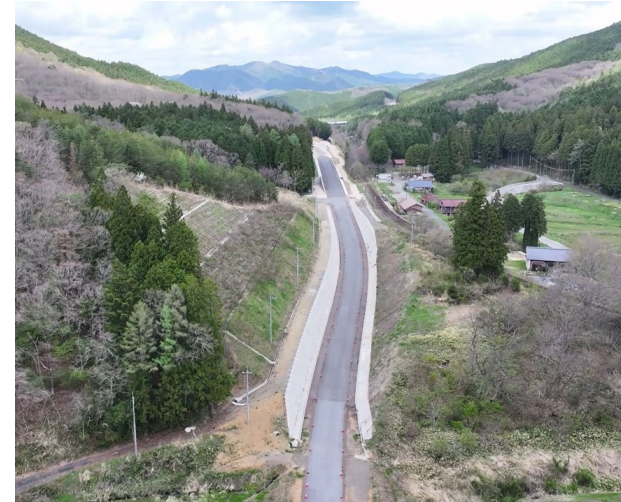
写真⑩ 令和5年度鍵掛峠道路高尾地区第3改良工事