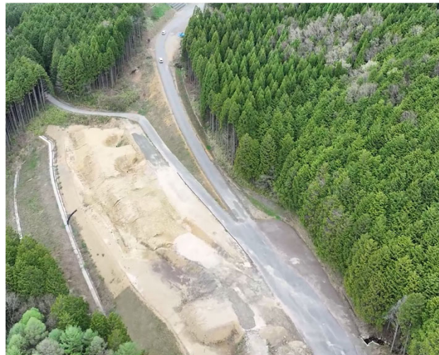
写真⑨ 令和7年度鍵掛峠道路小坪地区第6改良工事