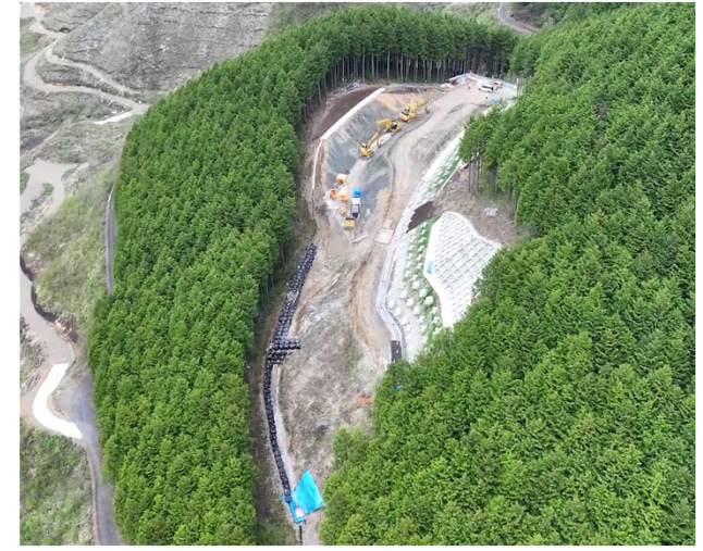
写真⑧ 令和6年度鍵掛峠道路小坪地区第5改良工事