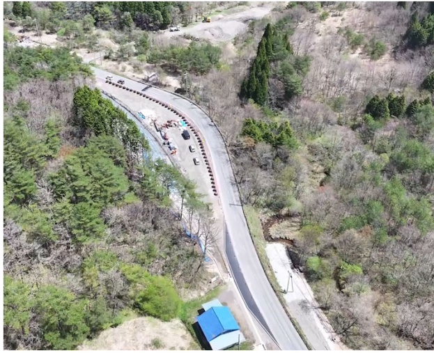
写真⑥ 令和6年度鍵掛峠道路三坂地区法面工事