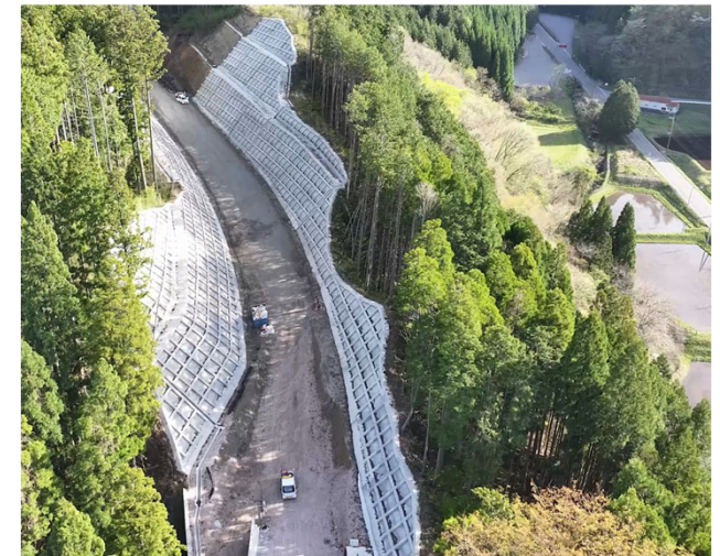
写真③ 令和7年度鍵掛峠道路新屋地区第13改良工事