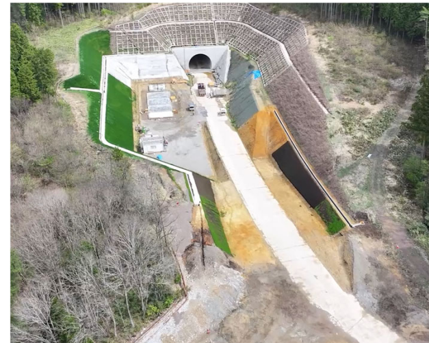
写真⑤ 令和6年度鍵掛峠道路トンネル電気室新築工事 令和7年度鍵掛峠道路小坪地区第7改良工事