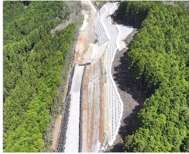
写真⑦ 令和6年度鍵掛峠道路保賀谷地区法面工事