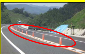
極太ポストコーン