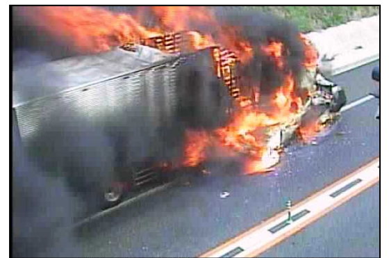
平成27年5月11日正面衝突事故