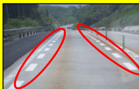
減速ドット区画線