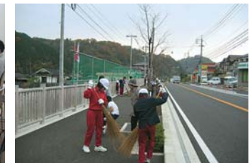
ボランティア・ロードの活動状況