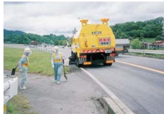
路面清掃車による路面清掃