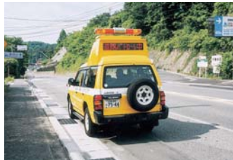
パトロール中の道路パトロールカー

また、道路環境の改善のため、舗装の低騒音舗装、落橋防止などの防災対策、橋梁の耐震補強等を行っています。