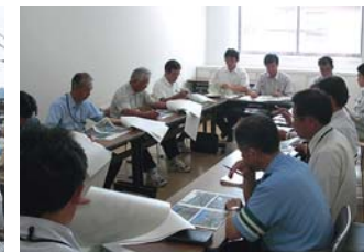
点検した内容について意見を出し合いとりまとめを行います