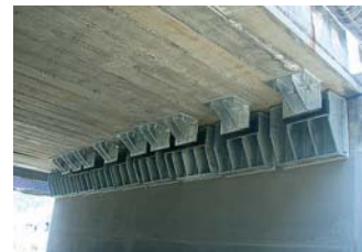
落橋防止対策施工