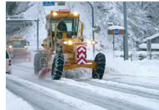
除雪機械による道路除雪