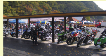
「ゆめランド布野」整備状況

世羅町においても道の駅を整備中(H27.5.23開業)であり、 魅力ある地域の拠点 となることで、観光の振興の拡大や雇用創出など、 地域がより一層活気づくことが期待 されます。