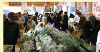
道の駅「たかの」のにぎわいの様子