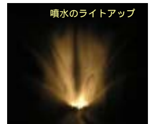
噴水のライトアップ