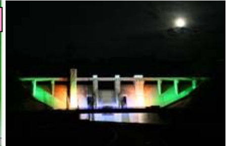
灰塚ダム堤体ライトアップ(イメージ)