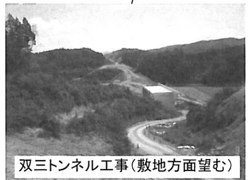
双三トンネル工事(敷地方面望む)