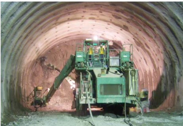
トンネル内の状況（覆工前）