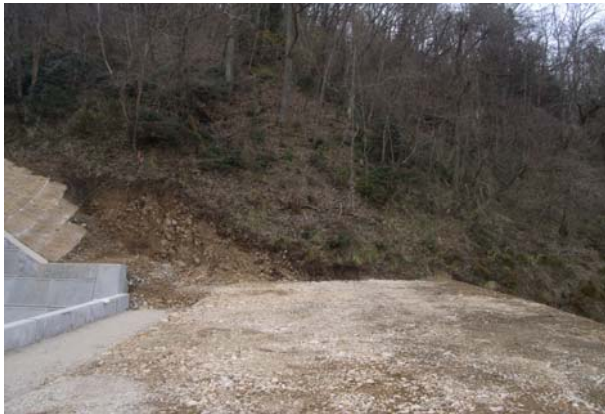
坑口の状況（着手前）