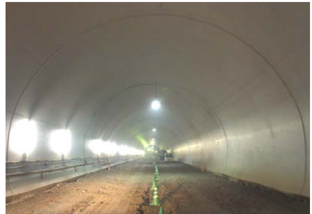
トンネル内の状況（覆工後）