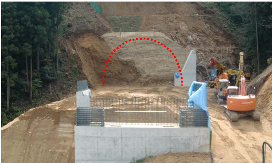
北側坑口の状況（ここから南側に向けて掘削を開始します。）