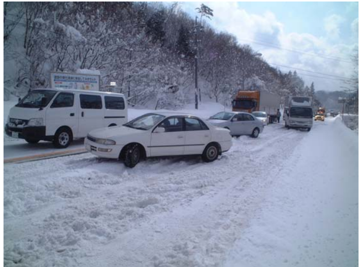
交通渋滞状況（赤名峠付近：三次側）

また、三次河川国道事務所管内や広島県北部の幹線道路の積雪など路面状態を伝えるインターネットサイト「備北雪街道」を12月開設（下記の【参考】を参照）予定ですので、お出かけ前にチェックしてみてください。