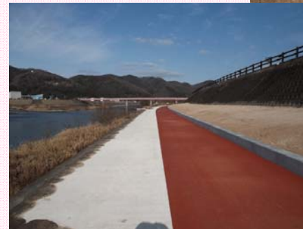
② 【みよしまちづくりセンター付近：護岸整備】 平成24年3月完成