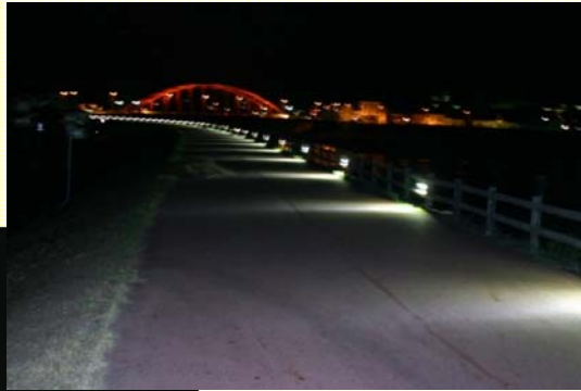
① 【巴橋周辺：街路灯・ベンチの整備】 平成23年3月完成