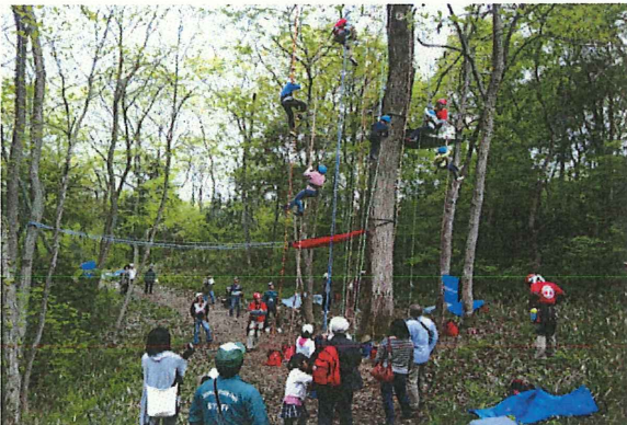
ツリークライミング体験