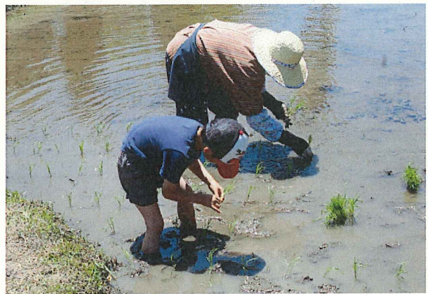
古代米づくり体験