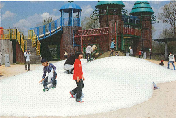
わた雲ドームで遊ぶ子供達