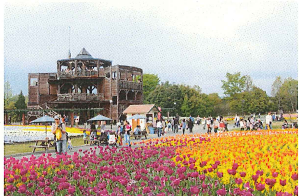
大勢の方がチューリップを観賞