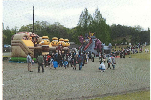
ふわふわキッズフレースペース