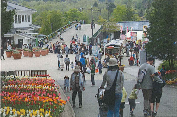
大勢の人でにぎわう中の広場