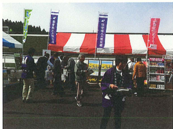
イベント時のPR実施状況