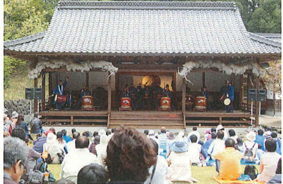
備北和太鼓フェスティバル