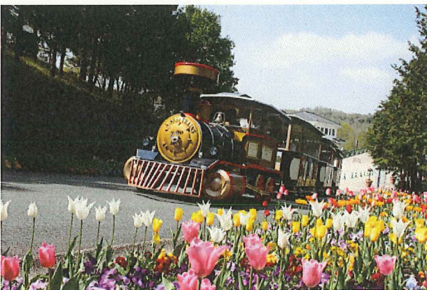
園内新交通システム(ロードトレイン)