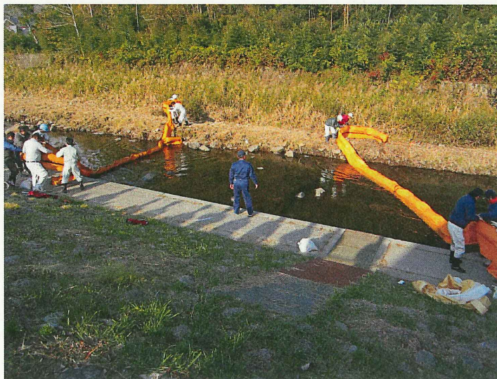
オイルフェンスの展張訓練