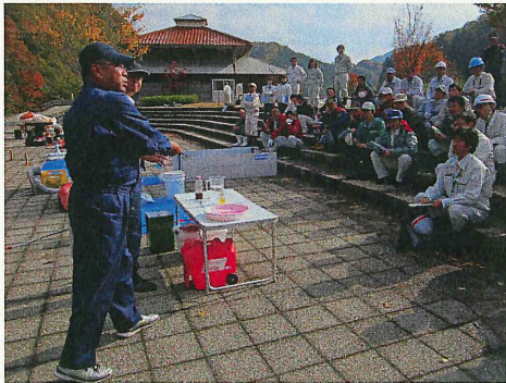
簡易水質分析の説明を受ける参加者

この度、水質事故対応に携わる関係機関の担当者70名が集まり、水質事故対応に関する意識・知識の向上、初動対応の重要性などについて関係機関相互で確認し、今後の事故対応に役立てるため、水質事故対策訓練を実施し、簡易水質分析やロープの結び方訓練、及びオイルフェンスの展張訓練などを行いました。