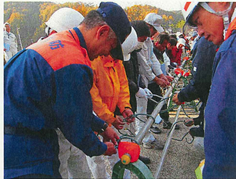
ロープの結び方訓練