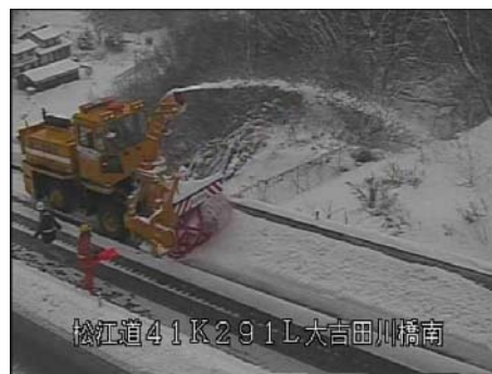
可能な場所はロータリー除雪車で道路の外に雪を飛ばします

今後も、まとまった積雪がある場合には、同様の作業を行うため、通行止めを行うことがあります 。交通量などを考慮し、計画的に作業を行いますので、 ご理解とご協力をよろしくお願いします 。