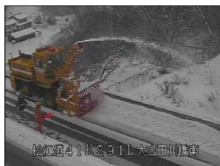
可能な場所はロータリー除雪車で道路の外に雪を飛ばします

今後も、まとまった積雪がある場合には、同様の作業を行うため、通行止めを行うことがあります 。交通量などを考慮し、計画的に作業を行いますので、 ご理解とご協力をよろしくお願いいたします 。