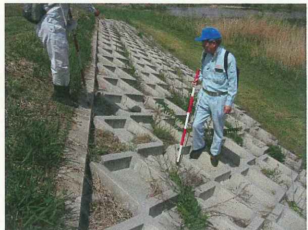
H 2 5 堤防点検の様子