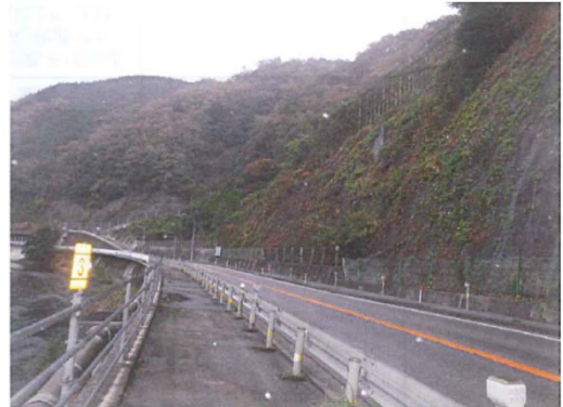
国道54号 三次市三次町