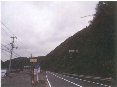
国道54号 三次市三原町