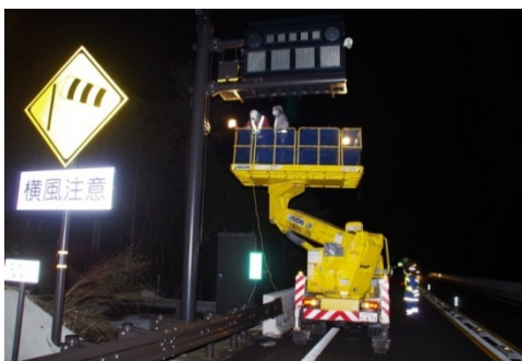
高所作業車による点検

車線上にある道路標識等について、高所作業車により近接で点検し、安全を確認します。