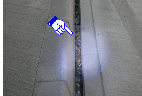
トンネルの側溝に堆積した土砂等