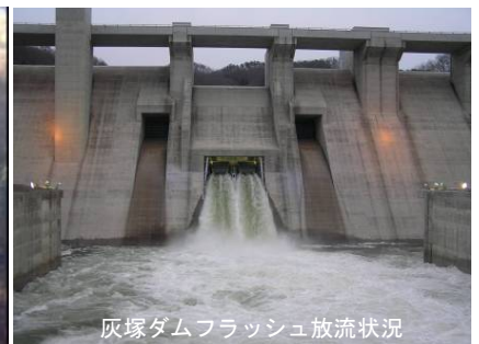
灰塚ダムフラッシュ放流状況

フラッシュ放流は、川の中にある石の表面を洗い流して、魚の餌となる付着藻類を剥離更新させるなどの河川環境保全を目的とした放流で、土師ダムでは平成15年度から、灰塚ダムでは平成18年度から実施しています。