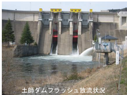
土師ダムフラッシュ放流状況