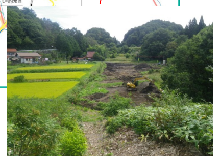
植木地区・工事中進入路造成工事