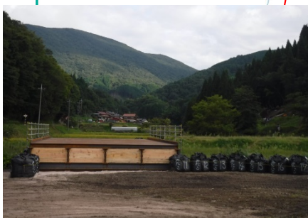
新屋地区・工事中進入路仮橋設置工事