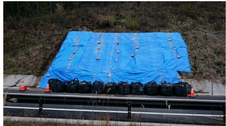
写真: 応急復旧状況