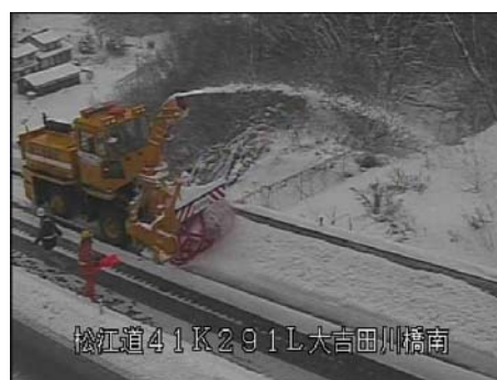
可能な場所はロータリー除雪車で道路の外に雪を飛ばします

今後も、まとまった積雪がある場合には、同様の作業を行うため、通行止めを行うことがあります 。交通量などを考慮し、計画的に作業を行いますので、 ご理解とご協力をよろしくお願いいたします 。