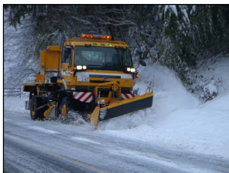
除雪トラックによる除雪

通常の除雪作業は、車道に積もった雪を除雪トラックを用いて路肩に押し寄せ、車が通行する幅を確保します。この作業は、 通行止めを実施せず 行う事ができますが、除雪トラックによる除雪を続けると、 押し寄せた雪が路肩にたまり、車が通行する幅が確保できなくなります 。この状態になると、 たまった雪を取り除くことが必要 になります。