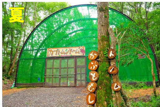
平成 7 年度より開催し、平成 27 年度に 20 年目を迎えた「夏まつり」、期間中の入園者数は 51,989 人