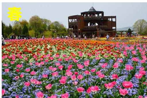
平成 8 年度より開催し、平成 27 年度に 19 年目を迎えた「春まつり」、期間中の入園者数は 105,504 人で開園以来歴代 3 位を記録