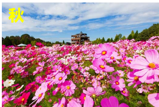
平成 7 年度よりコスモス修景を開始し、平成 27 年度に 20 年目を迎えた「秋まつり」、期間中の入園者数は 109,460 人