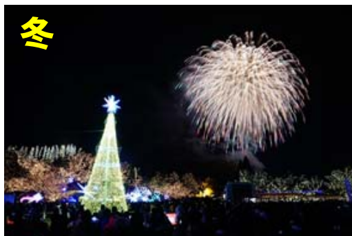
平成 7 年度より装飾を開始し、平成 27 年度に 20 年目を迎えた「ウインターイルミネーション」、期間中の入園者数が開園以来の過去最高を記録

平成 27 年度の国営備北丘陵公園の年間入園者数は、平成 26 年度の年間入園者数（423,695 人）を 98,811 人上回り、 522,506 人（前年比 1.23） となりました。