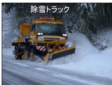
除雪トラックによる除雪

除雪トラックによる除雪を続けると、押し寄せた雪が路肩にたまり、車が通行する幅が確保できなくなります。