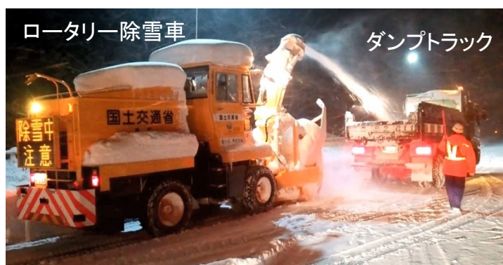
ロータリー除雪車を用いてダンプトラックへ積み込み

今後も、まとまった積雪がある場合には、同様の作業を行うため、通行止めを行うことがあります。