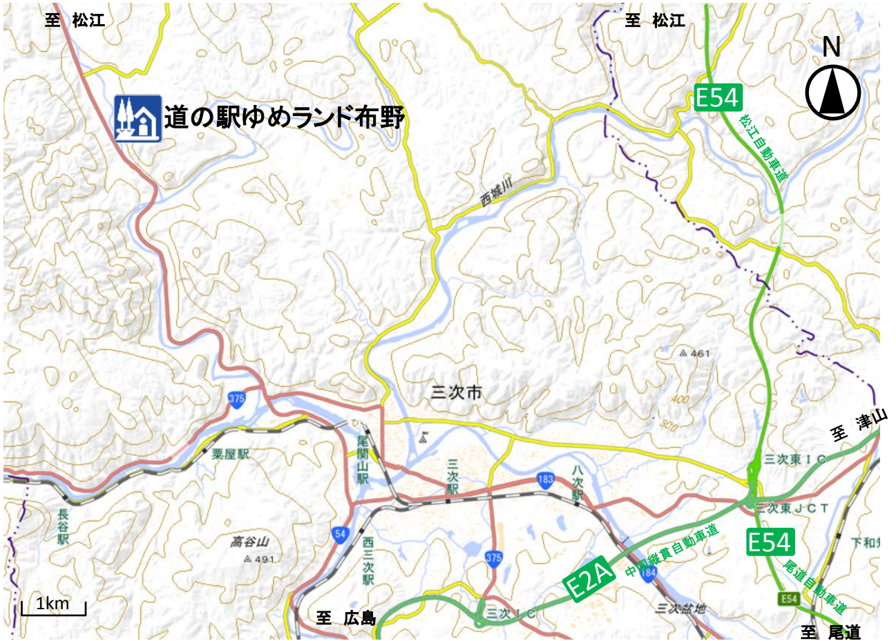
国土地理院地図を元に三次河川国道事務所が作成