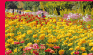
ジニア ZINNIA 9月中旬~10月中旬 [約20万本9品種]