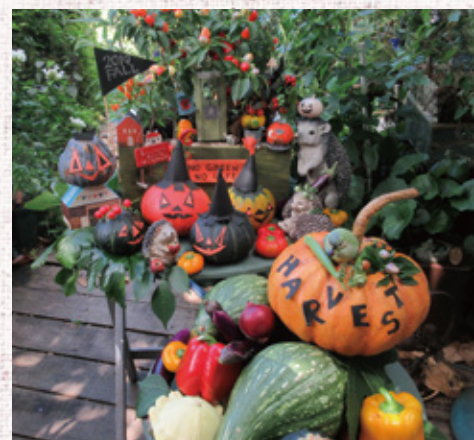
植栽&ディスプレイはここわガナー A・O'tani ※写真は8月制作のここわ、10月制作のここわは材料が異なります