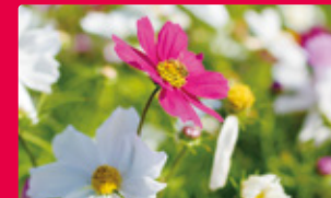
コスモス COSMOS 9月下旬~10月中旬 [約190万本4品種]

※開花状況(見頃の時期等)は、天候により変動する可能性がありますので、公園HP又は電話にてご確認ください。