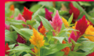
ケイトウ ARGENTEA 9月上旬~10月中旬 [約7万本1品種(2色)]