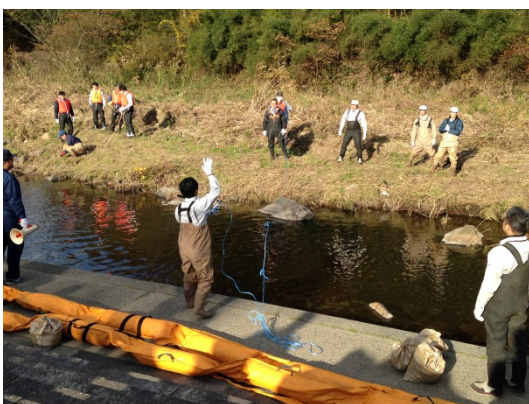
オイルフェンスの張り方訓練①