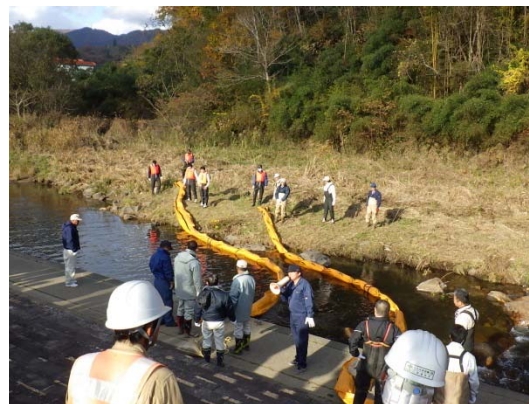
オイルフェンスの張り方訓練②

※ 江の川（上流）水質汚濁防止連絡協議会は、国土交通省三次河川国道事務所を事務局とし、江の川上流域の市・町、広島県、消防、警察等の機関で構成され、河川の水質事故等緊急時の連携対応や水質保全の推進に努めています。