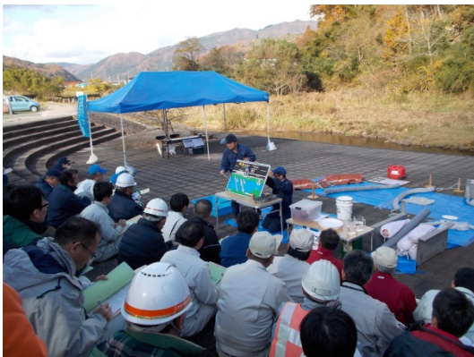
油の性質や処理方法の講習

これから油類の取扱いが多くなる冬季前に、広島県北部建設事務所の担当により、江の川水系上流域での水質事故対応に携わる関係機関の担当者約70名が集まり、水質事故対応に関する知識の向上、初動対応の迅速化を目的に、油類の特性や処理方法の講習、ロープ結びやオイルフェンスの張り方の対応訓練及び講習会を行いました。