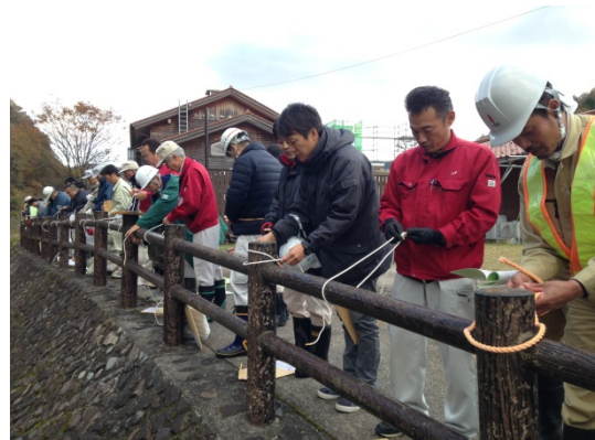
ロープの結び方訓練