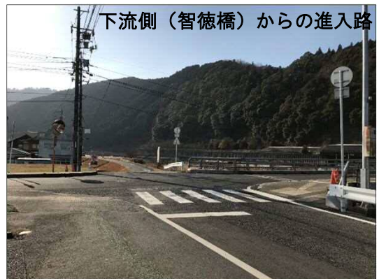
現地伐採箇所の状況（1月14日撮影）