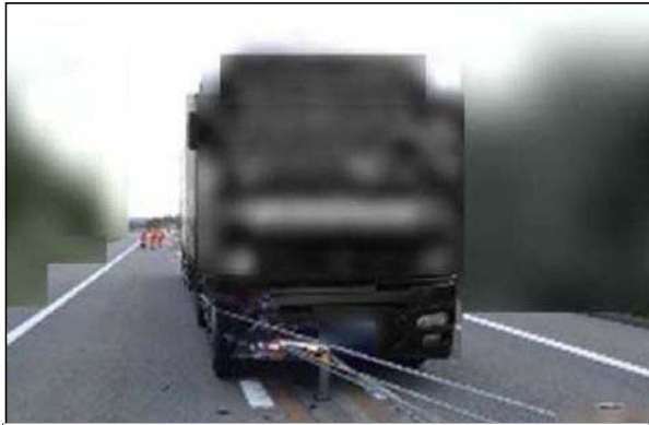
ワイヤロープにより、車線逸脱を防止