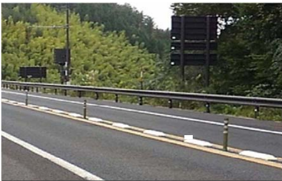
【設置前】松江自動車道(高野IC～雲南吉田IC)