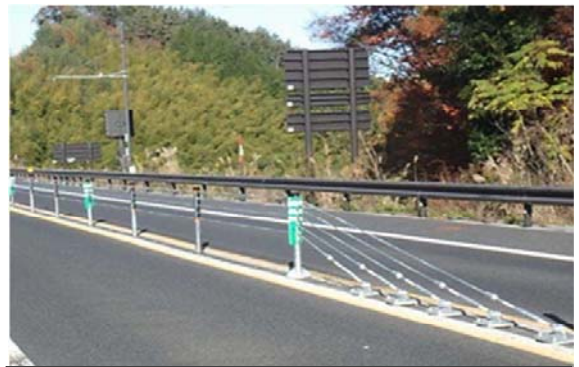
【設置後】松江自動車道(高野IC～雲南吉田IC)