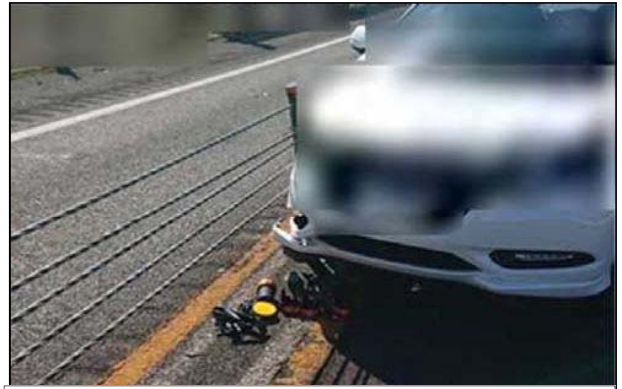
ワイヤロープにより、車線逸脱を防止