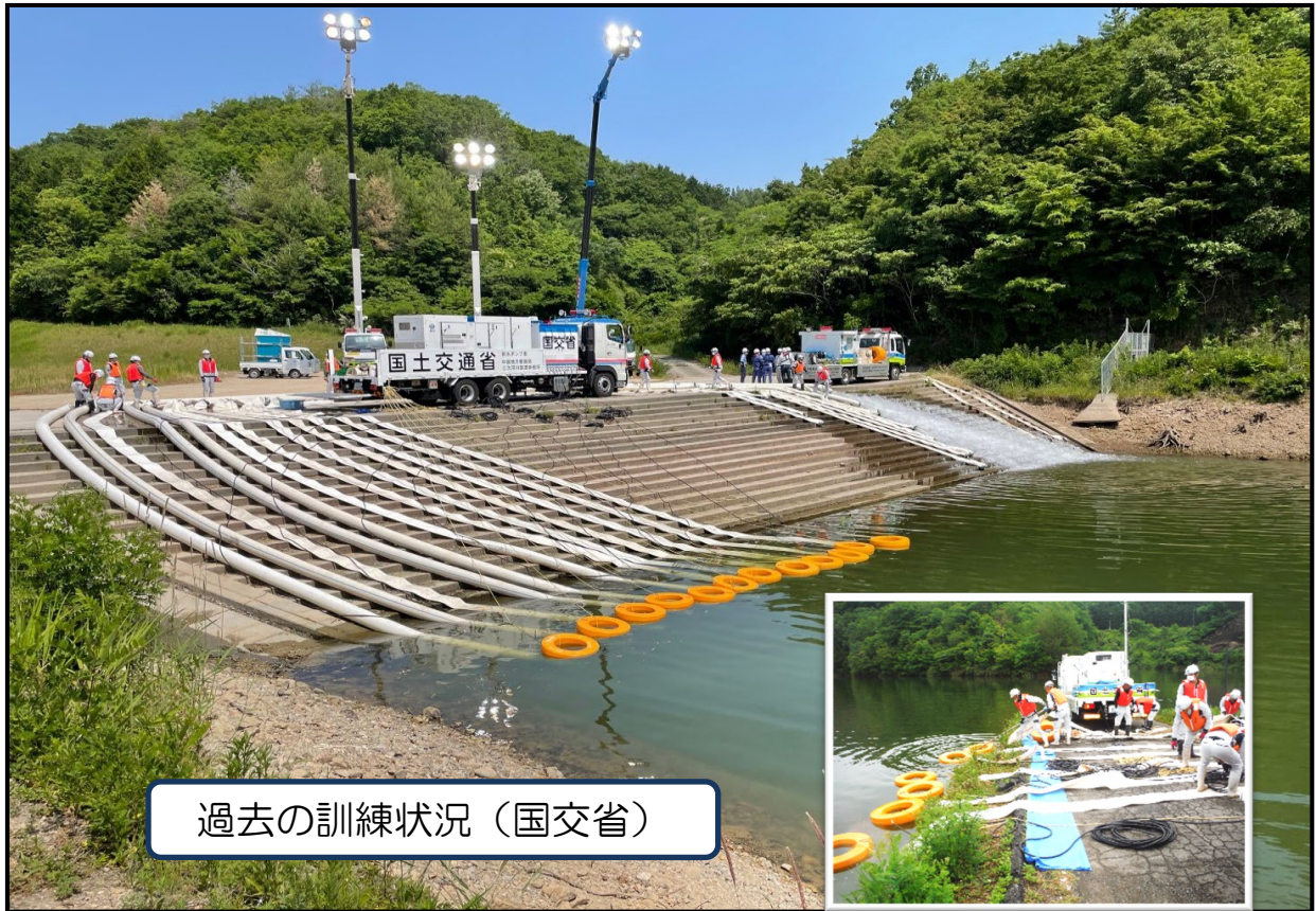
過去の訓練状況（国交省）