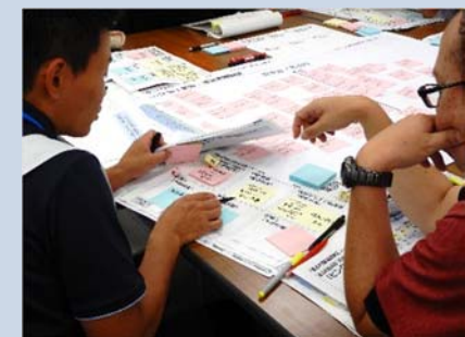
重点行動項目の具体化・細分化