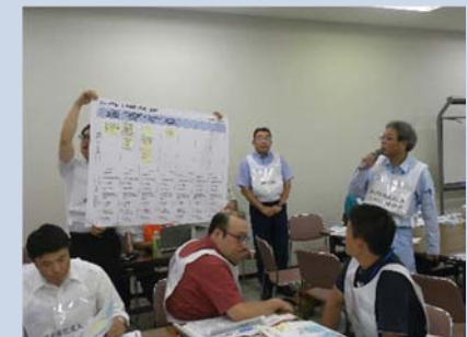
グループワークの成果発表