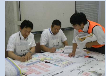
重点行動項目の具体化・細分化