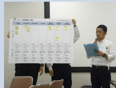
グループワークの成果発表