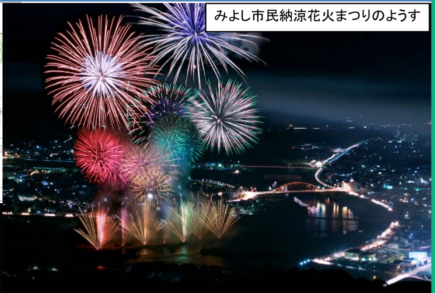
みよし市民納涼花火まつりのようす