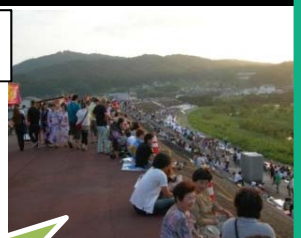
階段護岸を花火の観覧席に活用!

水辺整備により、 水辺の利便性が向上 し、夏の「花火大会」の 観覧席 や「鶺鴒い」の 乗船場 にも 活用 され、 利用者数も増加 。