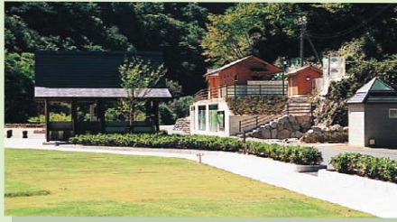
きじやばら レークサイド雉野原キャンプ場

自家用車：中国自動車道戸河内IC下車後、国道191号から国道186号を 通り約20分。広島方面からは、加計スマートIC下車後、国道191号 へ約15分。