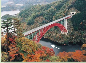
瀧山峡大橋(猪山展望台から望む)