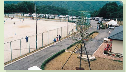
猪山スポーツ広場