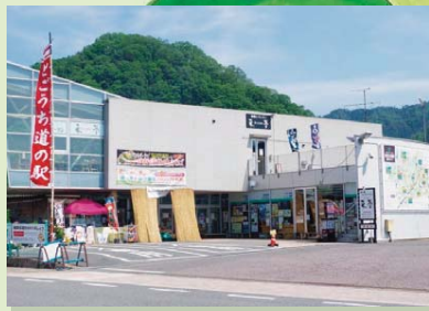
道の駅 来夢とごうち