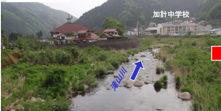
普段の加計中学校付近（滝山観測所水位約0.6m）