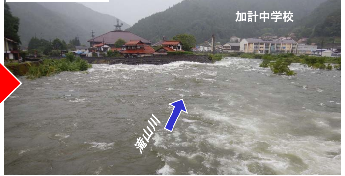
今回の洪水時の加計中学校付近（滝山観測所水位約3.28m）