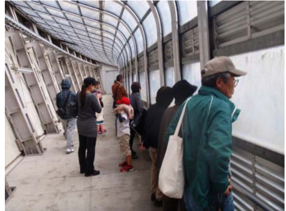
特別開放キャットウォーク