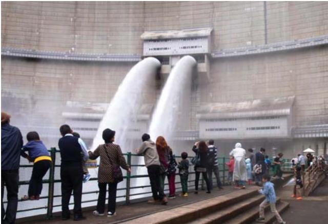
中位標高放流設備からの放流