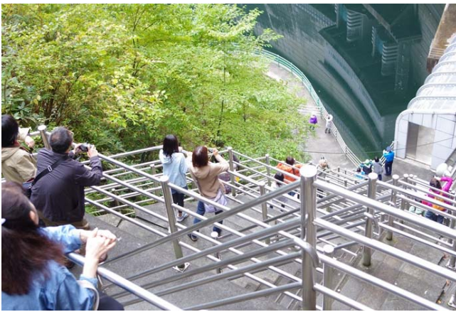
特別開放しわい階段