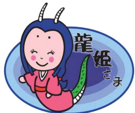
温井ダムイメージキャラクター 龍姫さま