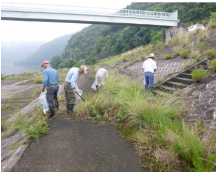
清掃状況（坂根地区自治会の皆さん）

国土交通省では、毎年7月を「河川愛護月間」と定めて河川愛護運動を実施しており、今後も地域の皆さんと一緒に清掃活動をはじめ、より良い河川環境の管理に努めてまいります。