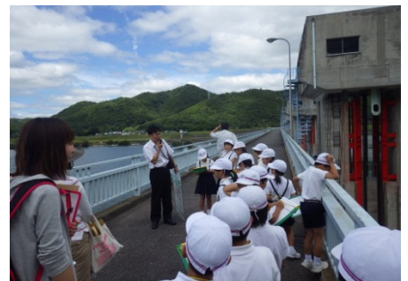
管理橋で、ゲートや魚道等の説明