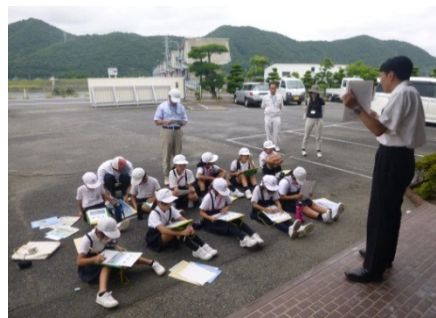
坂根堰の概要説明