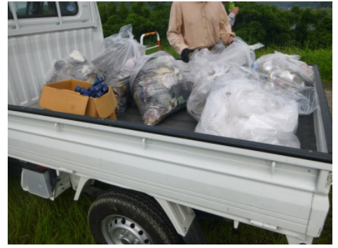
清掃で集めたゴミの量