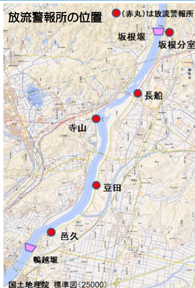
国土地理院 標準図(25000)