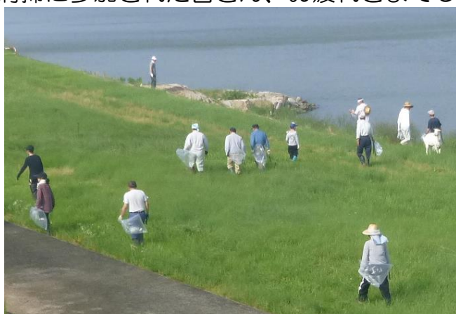
清掃状況(坂根地区自治会の皆さん)