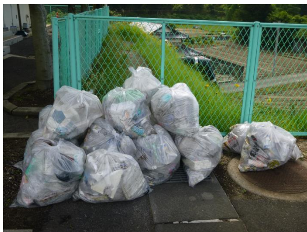
清掃で集めたゴミ